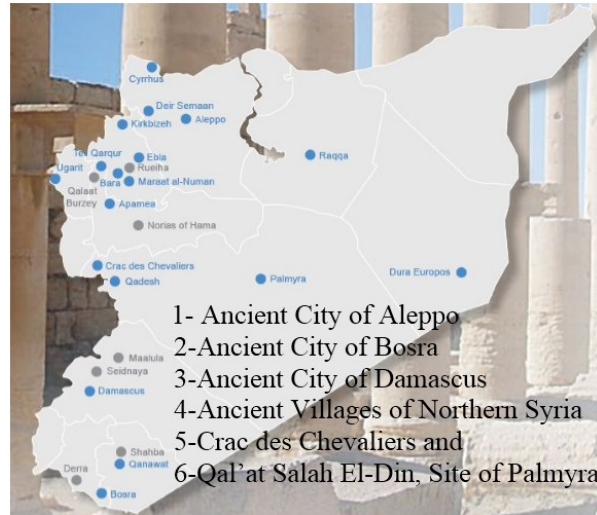
Şekil 2: Suriye UNESCO Tehlike Altındaki Dünya Mirası Alanları [18]

UNITAR tarafından “Suriye’deki Tarihi Alanlarda Uydu Tabanlı Hasar Tespiti-UNITAR/UNOSAT, 2014” hazırlanmıştır. Bu rapor Suriye’de devam eden çatışmalardan dolayı kültürel miras alanlarındaki önemli değişikliklerin detaylı analizini sağlamaktadır. 22 Mart 2010, 20 Ağustos 2014 ve 4 Ekim 2014 tarihlerindeki World View 1 ve 2 uydu görüntülerinden edinilen bilgiler bu raporda kullanılmıştır [18].